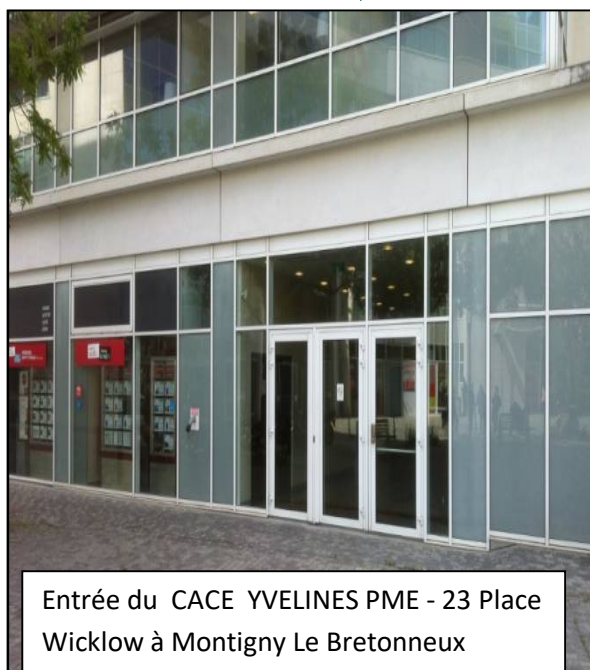
Entrée du CACE YVELINES PME - 23 Place Wicklow à Montigny Le Bretonneux